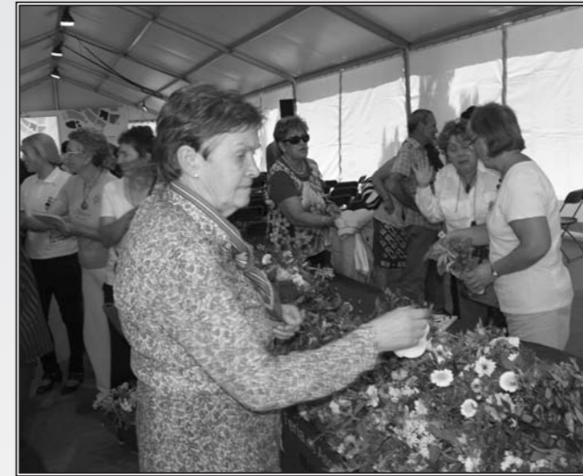
las chicas de Getxo Rugby, del Club Balonmano Kukullaga y del Club de

De cinco y media a seis, la coral Emays interpretó varias canciones y seguidamente, hasta las siete de la tarde se pudo escuchar la voz de las mujeres que practican deporte en equipo a través de